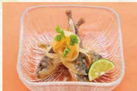
瀬戸の豆鰯南蛮漬け 400円 (税別)