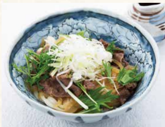
讃岐オリーブ牛の肉ぶっかけ 1,300円 (税別)