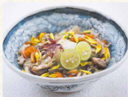
きのこのおろしうどん 700円 (税別)