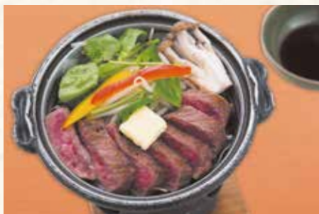
オリーブ牛陶板焼き 1,500円 (税別)