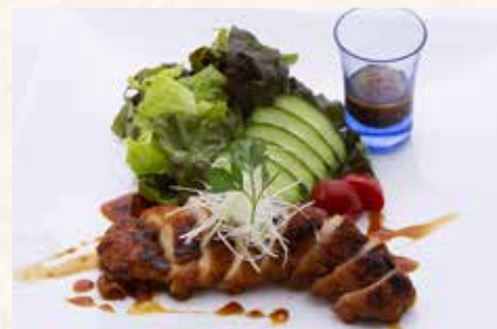
オリーブ地鶏桑焼き 900円 (税別)